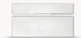
Smart Climate SENSE Erkennt offene Fenster sofort, senkt automatisch die Raumtemperatur ab und hilft somit Energie und Geld zu sparen.