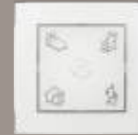
Smart Climate SWITCH Per Fingertipp ganz einfach zwischen den Programmen wechseln. Ohne Zugriff auf die App.