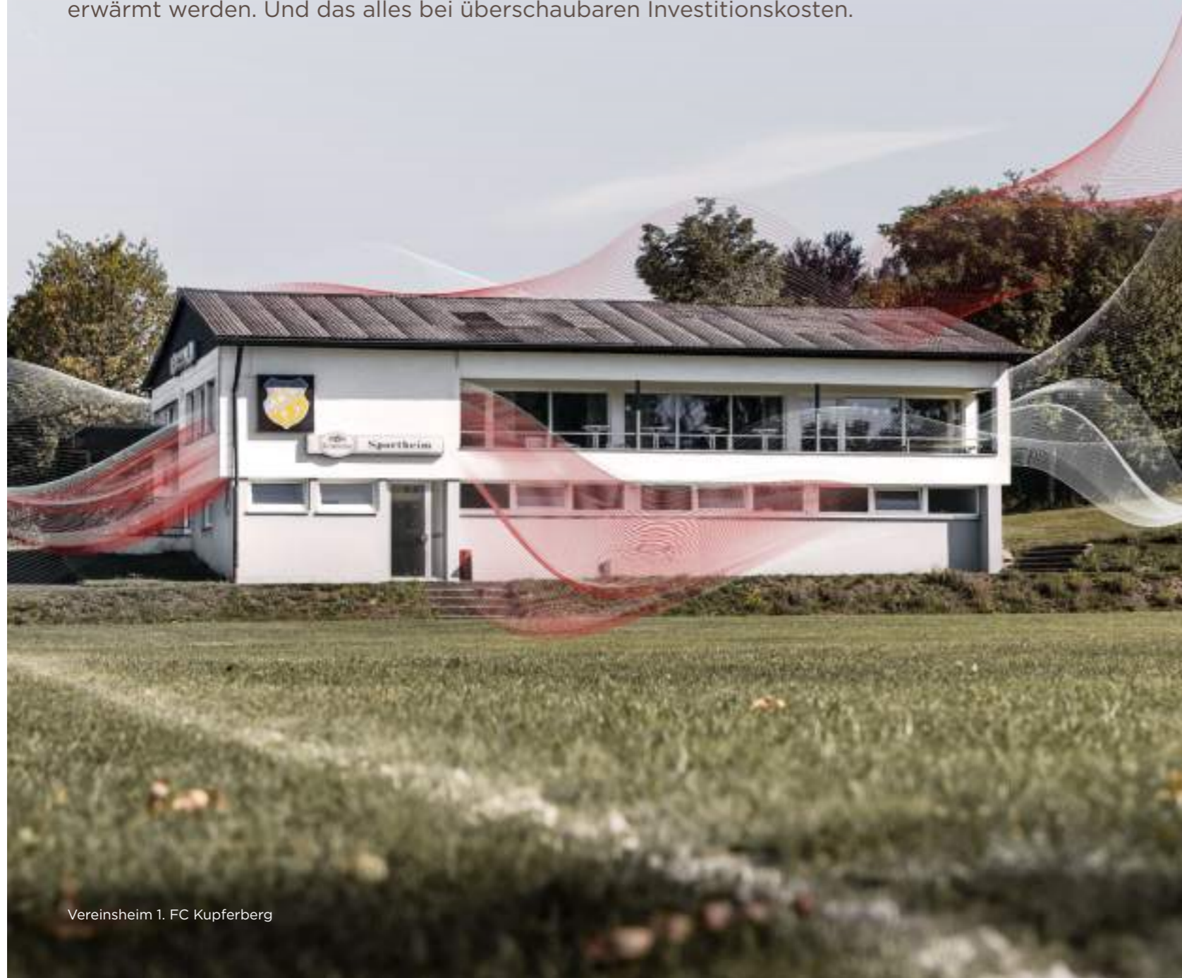
Vereinsheim 1. FC Kupferberg

Das DIMPLEX Smart Climate System eignet sich hervorragend für Räumlichkeiten, für die eine permanente Beheizung energetisch nicht wirtschaftlich wäre. Sofern ein Internetanschluss vorhanden ist, kann der Raum zu einem beliebigen Zeitpunkt schnell und effizient aus der Ferne erwärmt werden. Und das alles bei überschaubaren Investitionskosten.