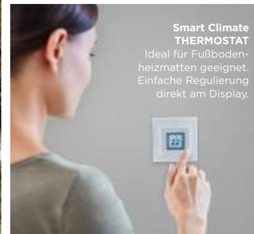
Smart Climate THERMOSTAT Ideal für Fußbodenheizmatten geeignet. Einfache Regulierung direkt am Display.

Sommerhäuser Ferienwohnungen Vereinsheime Öffentliche Gebäude Studentenwohnheime Hotelzimmer Gewerbe